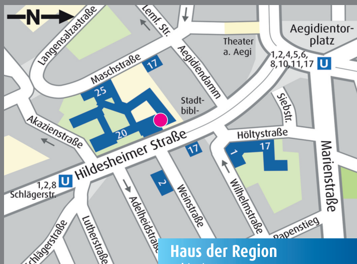
Haus der Region Hildesheimer Str. 18 · Hannover

Die TeilnehmerInnenzahl ist begrenzt. Wir bitten daher um frühzeitige Anmeldung bis zum 10. Oktober unter www.fachforum-vereinbarkeit.de