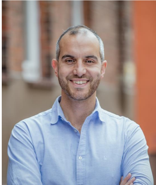
Belit Onay - Oberbürgermeister der Stadt Hannover