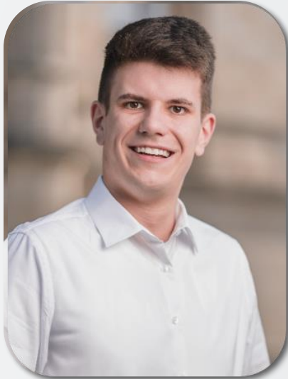
Luca Conrady Kooperationen E-Mail